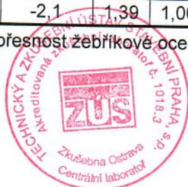
Tabulka č. 6: Tvarová a rozměrová přesnost žebříkové oceli